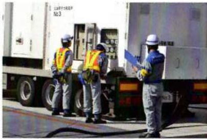
●発電所へ電気を送る訓練