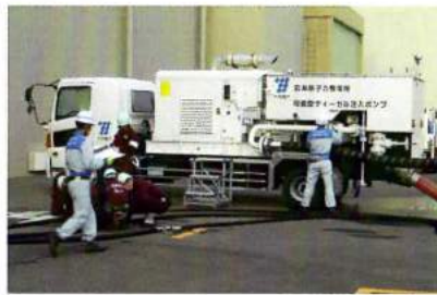
●原子炉などに水を送る訓練