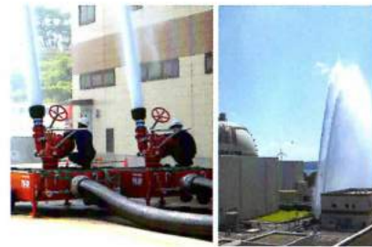
●環境へ放射性物質を上げない訓練