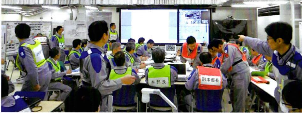
●国や自治体等との連絡、現場への指揮を行う訓練（代替緊急時対策所）

現在、重大事故時に迅速かつ確実に対応できるよう各種訓練を繰り返し実施しています。