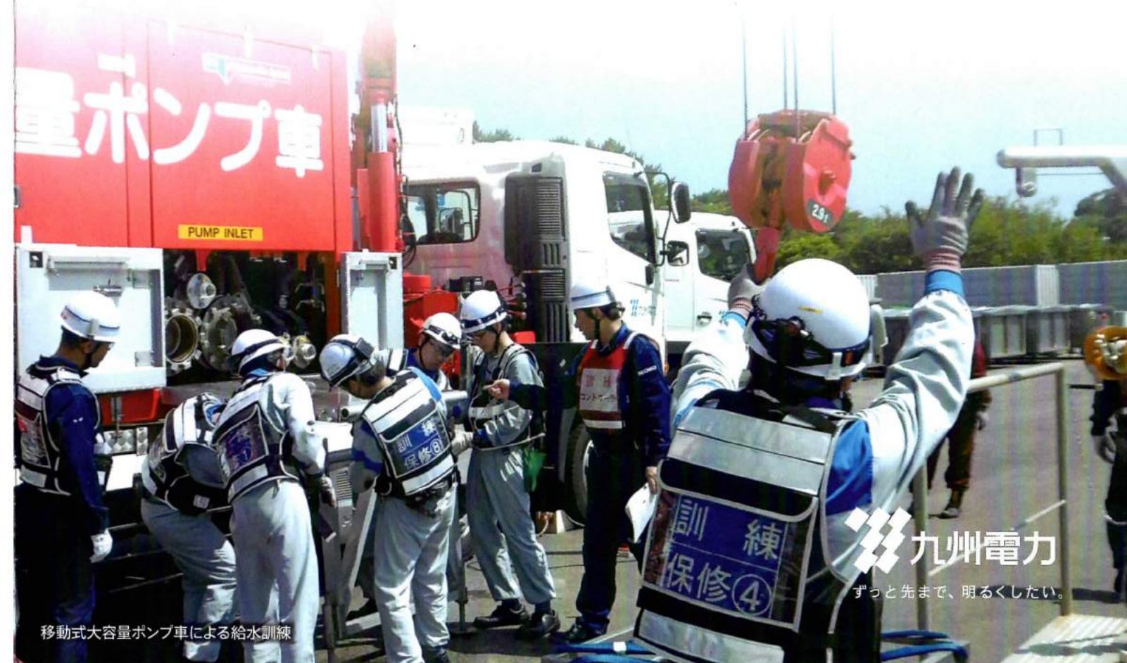
移動式大容量ポンプ車による給水訓練

私たちは、新規制基準を遵守することはもちろんのこと、常に国内外の知見を求め、地域の皆さまの声もお聴きし、自主的・継続的な活動を積み重ねることで、絶えず安全性向上に取り組んでまいります。